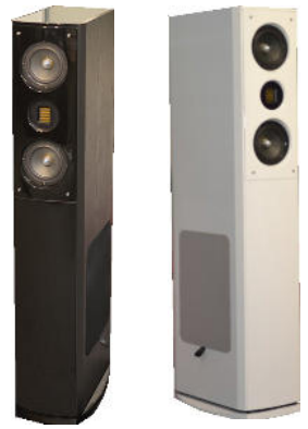
EL1 schwarz EL1 weiss